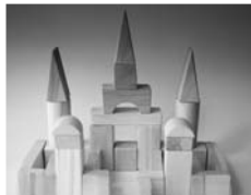
Spielräume für Projekte und Innovation