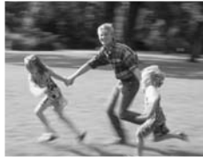
Unterstützung Wachstum Motivation