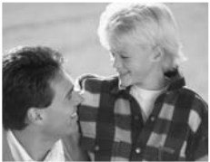
Perspektiven und Aufgaben

Daher soll sich die Einnahmenstruktur der AJ sukzessive zu einem Dreiklang aus öffentlichen Fördermitteln, Zuschüssen