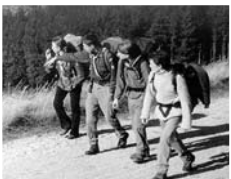
Investition in die Gegenwart und Zukunft